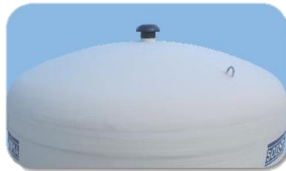
Chapeau évent Ø 160 PVC avec moustiquaire