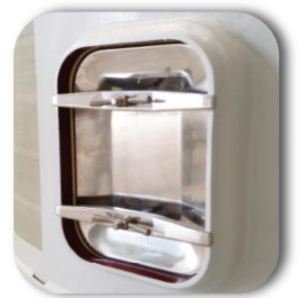
Porte rectangulaire autoclave inox