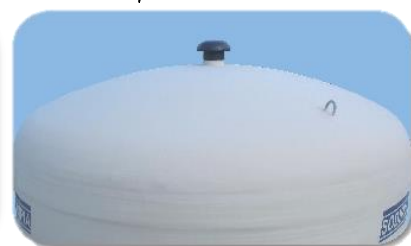
Chapeau évent Ø 160 PVC