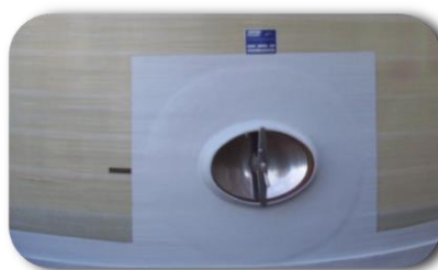
Porte ovale autoclave 316L